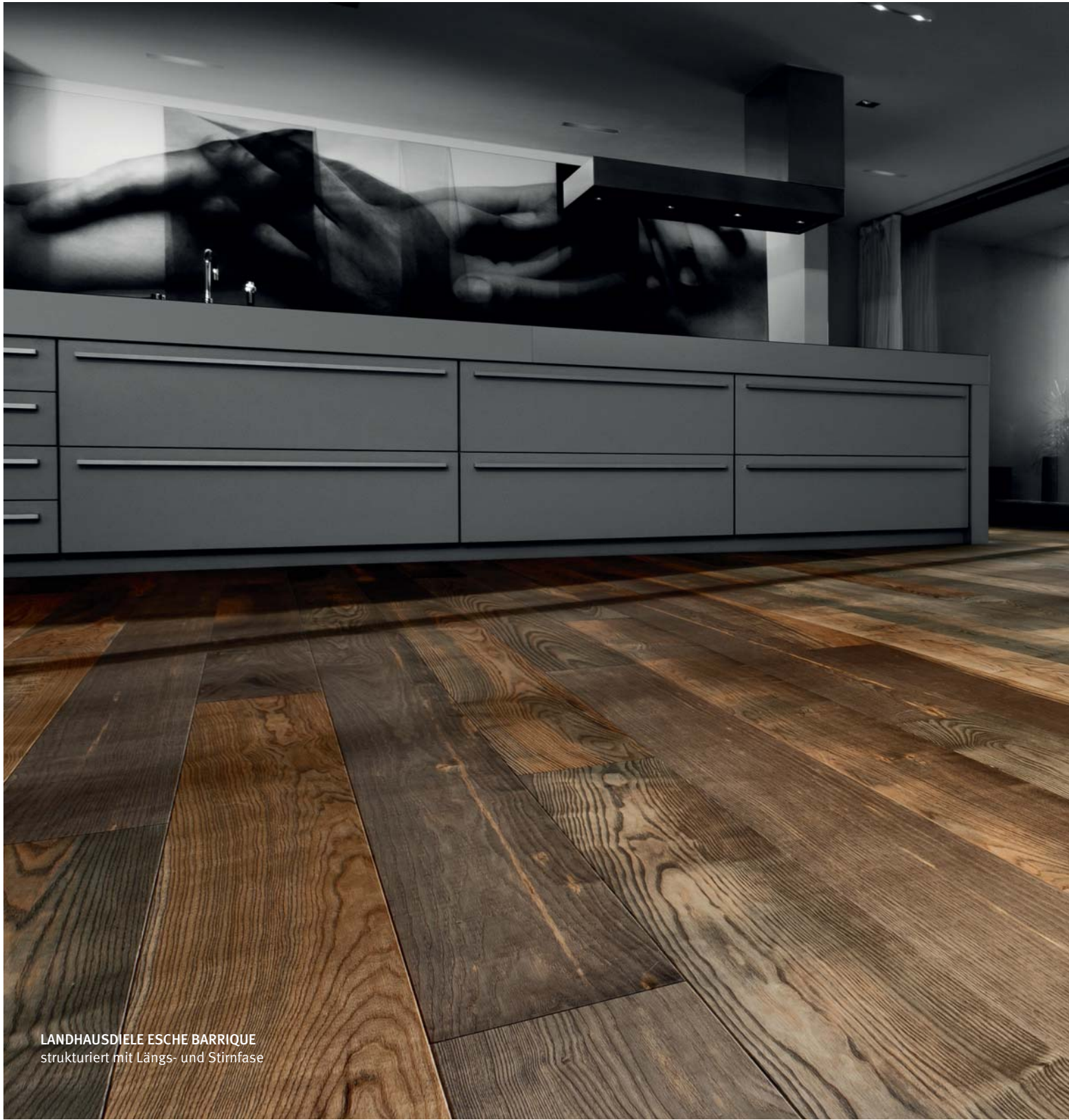
LANDHAUSDIELE ESCHEN BARRIQUE strukturiert mit Längs- und Stülfase

Nicht nur Oberfläche – ich will auch Tiefe.