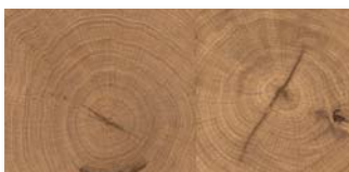
CARRÉ EICHE SELECTIV