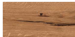
EICHE NUBIA Strukturiert mit Längsfase