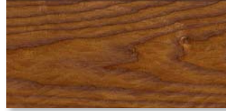
ESCHE ARABICA MEZZO SELECTIV