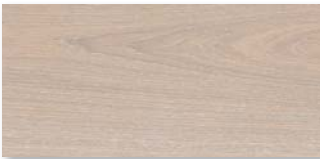
EICHE KALKWEISS SELECTIV