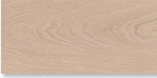
EICHE WEISS SELECTIV