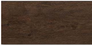
LANDHAUSDIELE XL RÄUCHEREICHE Strukturiert mit Längs- und Stirnfase 1,80 – 2,20 m