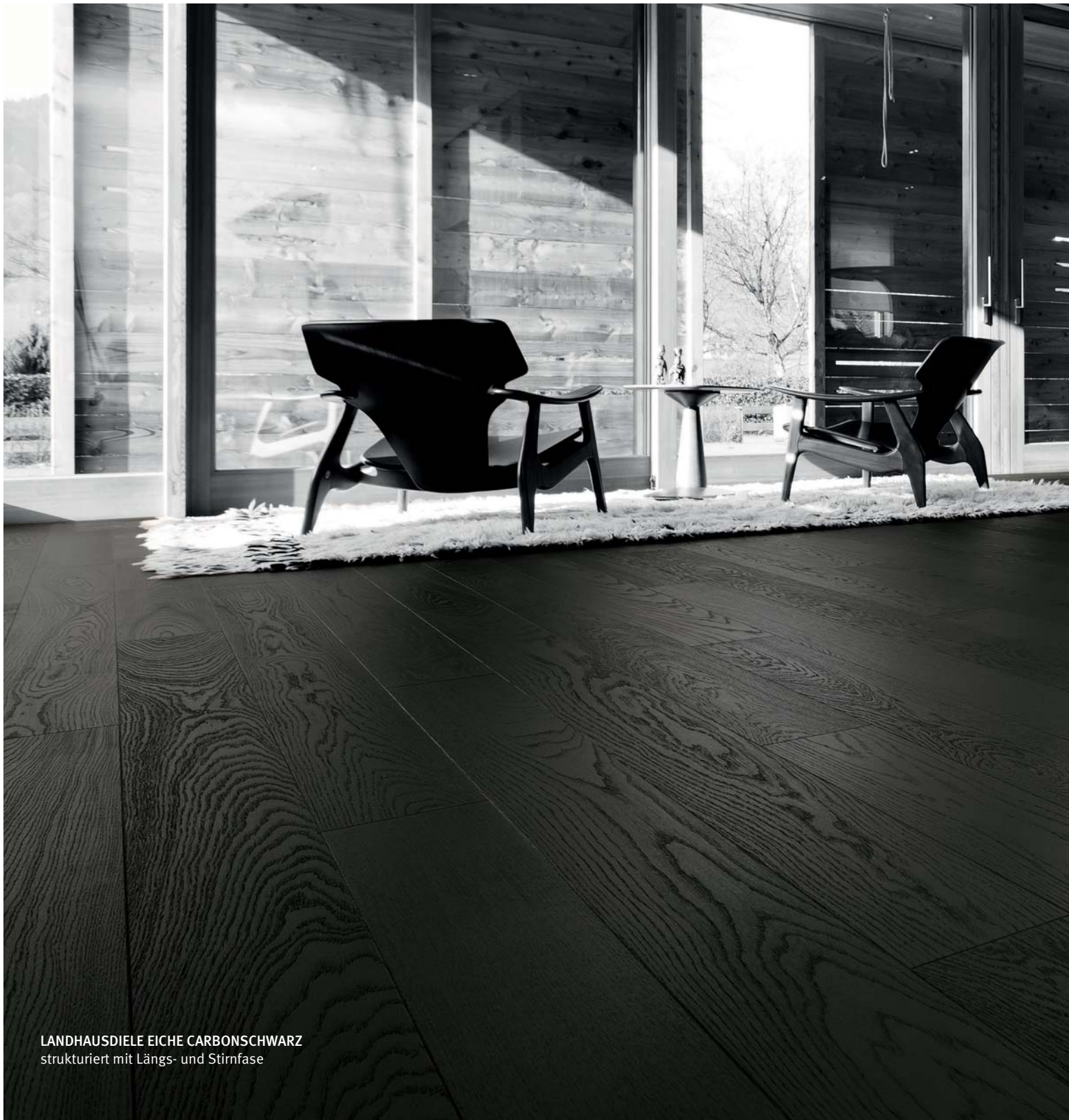
LANDHAUSDIELE EICHE CARBONSCHWARZ strukturiert mit Längs- und Stümfase