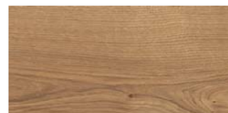
UREICHE Strukturiert mit Längs- und Stirnfase