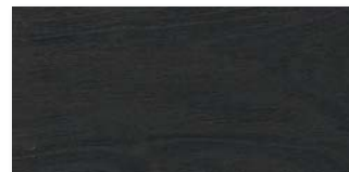
EICHE CARBONSCHWARZ SELECTIV Strukturiert mit Längs- und Stirnfase