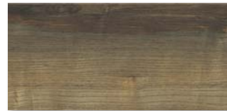
ESCHE OLIVGRAU EXPRESSIV Strukturiert mit Längs- und Stirnfase