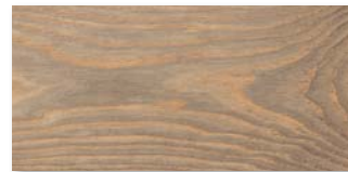
ESCHE BARRIQUE SELECTIV Strukturiert mit Längs- und Stirnfase