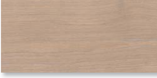
EICHE BLAUGRAU SELECTIV