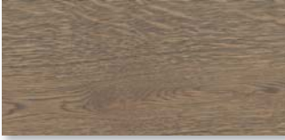
EICHE BRAUNGRAU SELECTIV