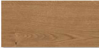
LANDHAUSDIELE XL 3m/4m EICHE Strukturiert mit Längs- und Stirnfase