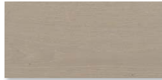
EICHE BEIGEGRAU SELECTIV