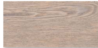
EICHE BARRIQUE WEISS SELECTIV Strukturiert mit Längs- und Stirnfase