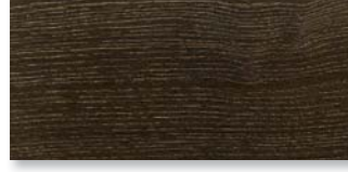
ACHATEICHE GOLD GEKALKT SELECTIV