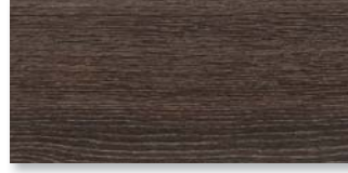
ACHATEICHE SILBER GEKALKT SELECTIV