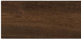
LANDHAUSDIELE XL 3m/4m RÄUCHEREICHE Strukturiert mit Längs- und Stirnfase