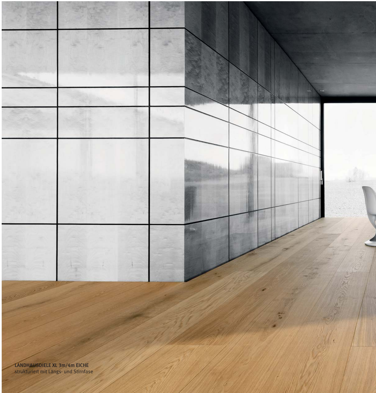
LANDHAUSDIELE XL 3m/4m EICHE strukturiert mit Längs- und Stümfase

Freiheit, Größe, Grenzenlosigkeit – die XL-Dielen. Schöne Gestalt: schlank und edel.