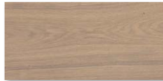
EICHE NATURGRAU SELECTIV