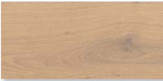
EICHE NATURWEISS SELECTIV