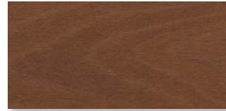
BUCHE AMARENABRAUN EXPRESSIV Strukturiert mit Längs- und Stirnfase