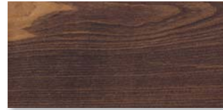
BUCHE KASTANIENBRAUN EXPRESSIV Strukturiert mit Längs- und Stirnfase