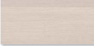
EICHE WEISS EXCELLENT