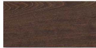
BUCHE KASTANIENBRAUN SELECTIV Strukturiert mit Längs- und Stirnfase