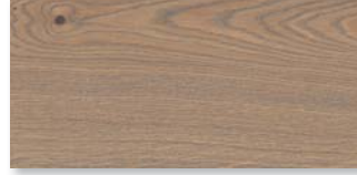
EICHE SILBERGRAU SELECTIV