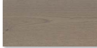
EICHE BASALTGRAU SELECTIV