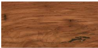
LANDHAUSDIELE EICHE ALTHOLZ Strukturiert mit Längsfase