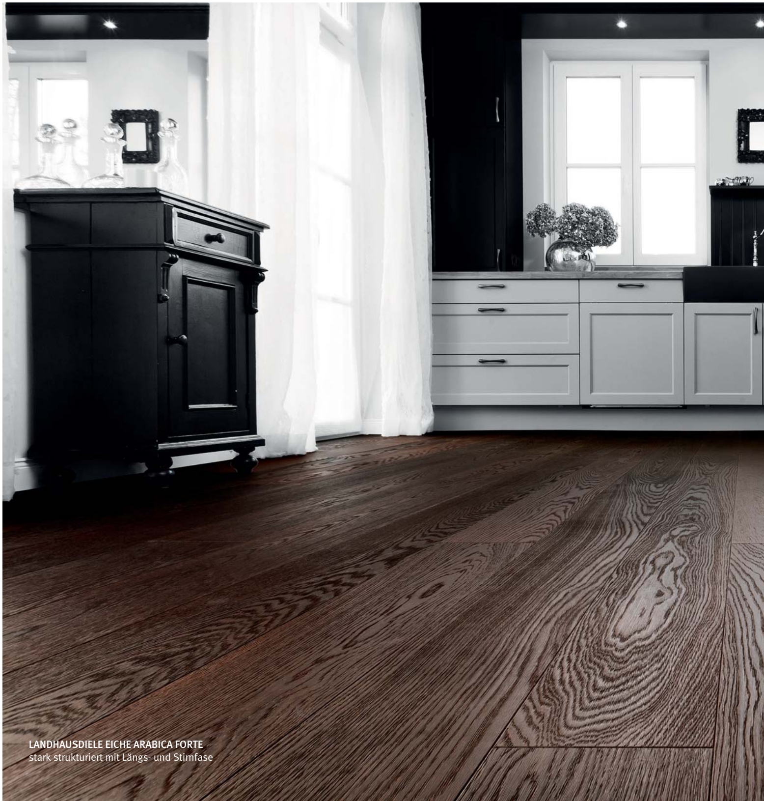
LANDHAUSDIELE EICHE ARABICA FORTE stark strukturiert mit Längs- und Stirnfase

Unverwechselbarkeit, Handwerk – Individualisierung. Mehr Handwerk erleben.