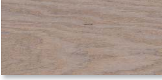
BERNSTEINEICHE WEISS SELECTIV