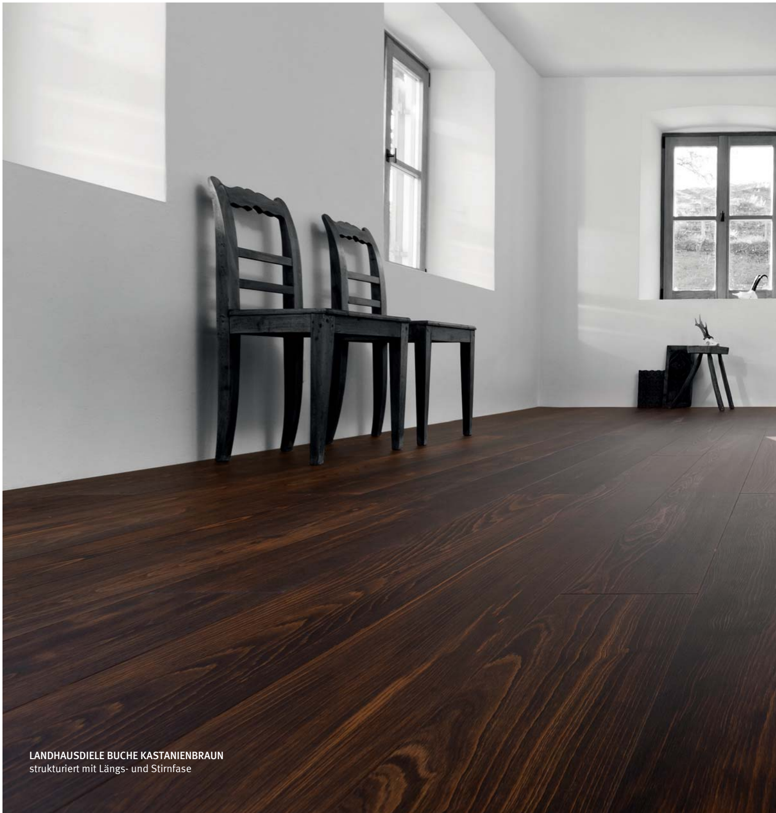
LANDHAUSDIELE BUCHE KASTANIENBRAUN strukturiert mit Längs- und Stirnfase