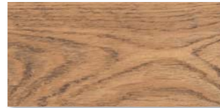
EICHE BARRIQUE SELECTIV Strukturiert mit Längs- und Stirnfase