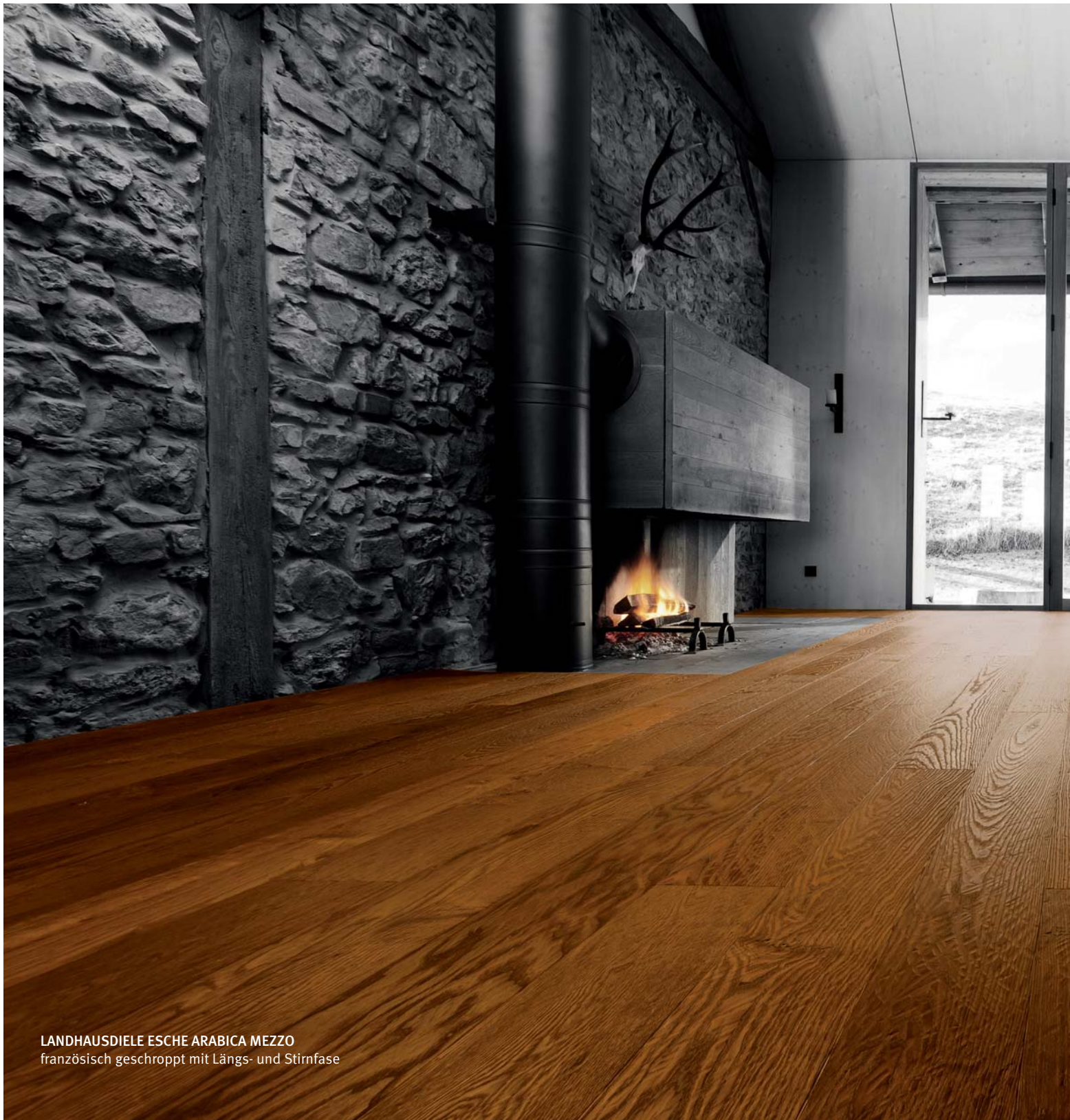
LANDHAUSDIELE ESCHEN ARABICA MEZZO französisch geschroppt mit Längs- und Stülfase

Einfach einzigartig – perfekt für meinen Lebenstraum.